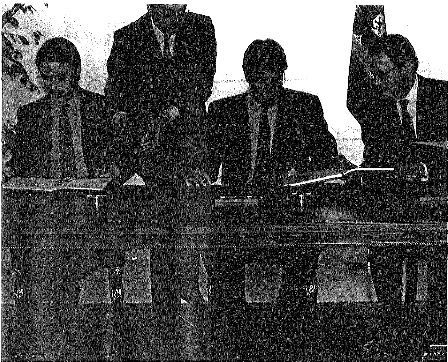
El presidente Felipe González y el líder del Partido Popular, José M a Aznar, firman el Pacto Autonómico.

o de vía lenta como los demás, se aprobaron a medida que estuvieron listos en varios bloques: tres el 30 de diciembre del 81; tres más entre junio y julio del 82; otros tres, y el Amejoramiento de Fuero de Navarra, que desempeña análogas funciones en esa región, en agosto del 82 y, finalmente, los cuatro restantes (entre ellos el de Madrid) el 25 de febrero del 83.